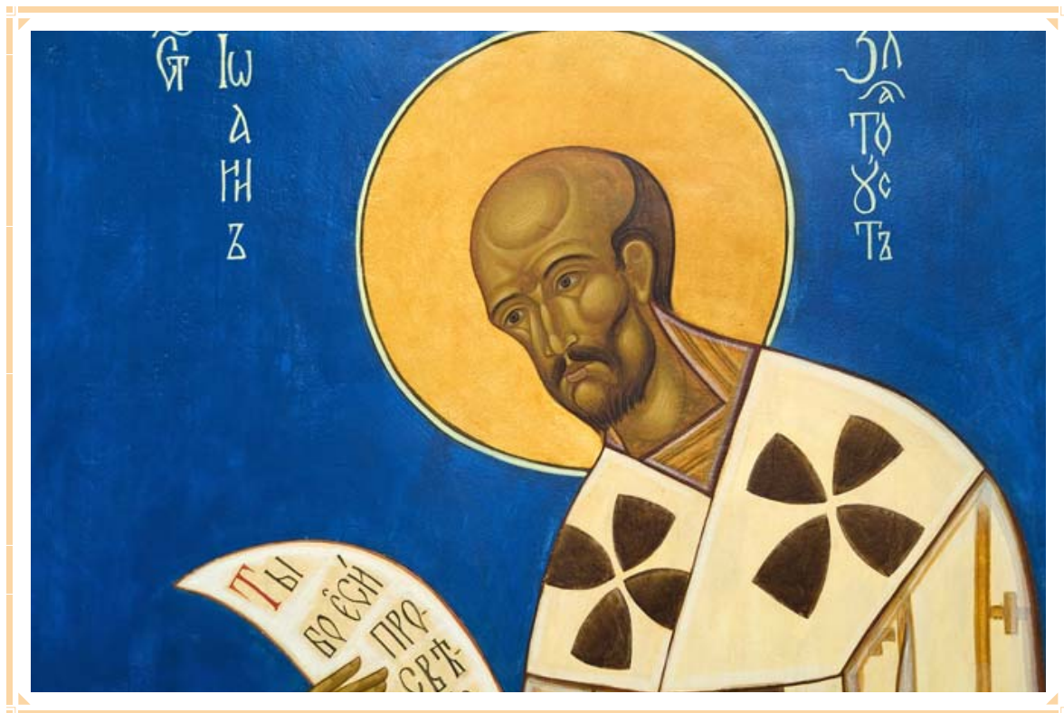
SAINT JEAN CHRYSOSTOME