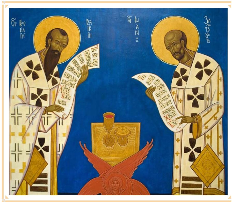
SAINTE BASILE LE GRAND ET SAINT JEAN CHRYSOSTOME